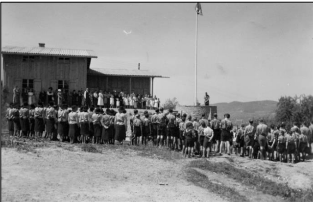
Abb. 8: Einweihung des Pfadiheims am 4. Juni 1939, Ansprache des Kantonalfeldmeisters.

Aus dieser Zusammenstellung der Dokumentation ist ersichtlich, dass die Entstehung bzw. die Akzeptanz des Pfadiheims Reinach (Abb. 9) vor 80 Jahren eine freudige, teils aber auch dornenvolle Angelegenheit für die damalige Pfadigemeinschaft war. Ja, das waren noch Zeiten.