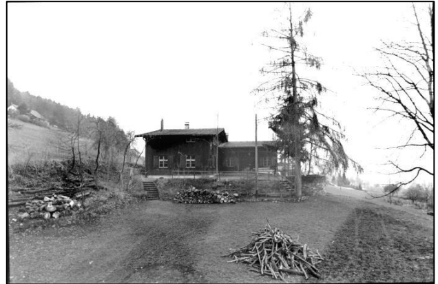
Abb. 9: Pfadiheim (etwa 1939).

Dieser Beitrag wurde anhand von Dokumenten aus dem Archiv der Pfadi Rymenzburg von Zibo erstellt und erschien in den „Rymenzburger Nachrichten“ vom Sommer 2018.