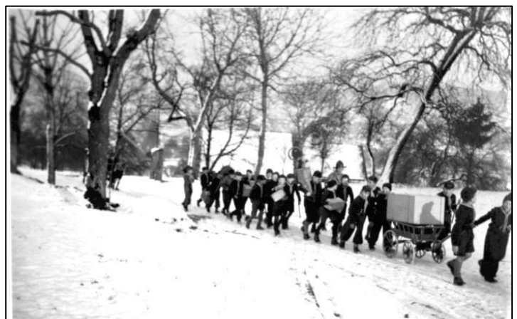
Abb. 6: Umzug von der Kirchgasse in Menziken ins neue Heim am Reinacherberg (Januar 1939).