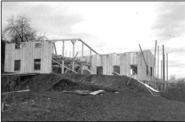
Abb. 3: Aufbau des Pfadiheims (Dezember 1938).

der Aargauische Pfadfinderverband wie auch der Bund Schweizerischer Pfadfinderinnen (BSP).