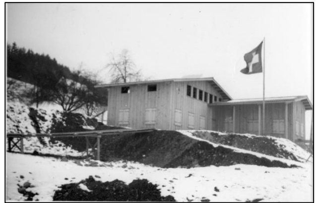
Abb. 4: Pfadiheim im Rohbau (Januar 1939).